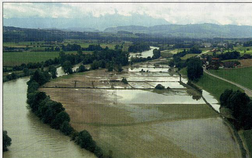
Im Luffoto von den Überschwemmungen im Jahr 2005 ist die geplante Fläche für den Auenpark sichtbar.

Die Wasserversorgungs-Genossenschaft Sins und Umgebung fördert rund zwei Drittel ihres Trinkwassers im Sinscher Schachen. Die Moderne Melioration sieht hier vor, dass die Grundflächen der Schutzzone 1 und 2 der Trinkwasserfas-